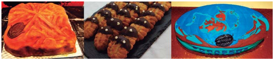
Figura 1 Pastelaria inspirada na Geodiversidade do Geopark Naturtejo: produção de marcas de alimentação por trilobites, modelos de trilobite, paleogeografia no período Ordovícico.