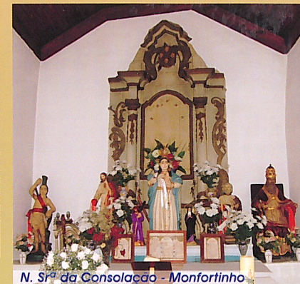
N. Sr. da Consolação - Monfortinho