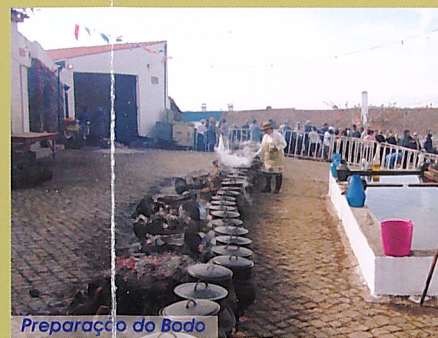
Preparação do Bodo

Indigitados pela comissão cessante ou por voluntariado, três bodeiros (um presidente, um tesoureiro e um secretário) são responsáveis pelo almoço de toda a população local e das aldeias vizinhas, incluindo da Extremadura, numa manifestação de abundância e reconhecimento.