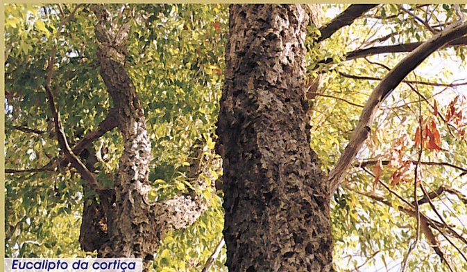
Eucalipto da cortiça