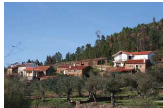
Aldeia de Martim Branco