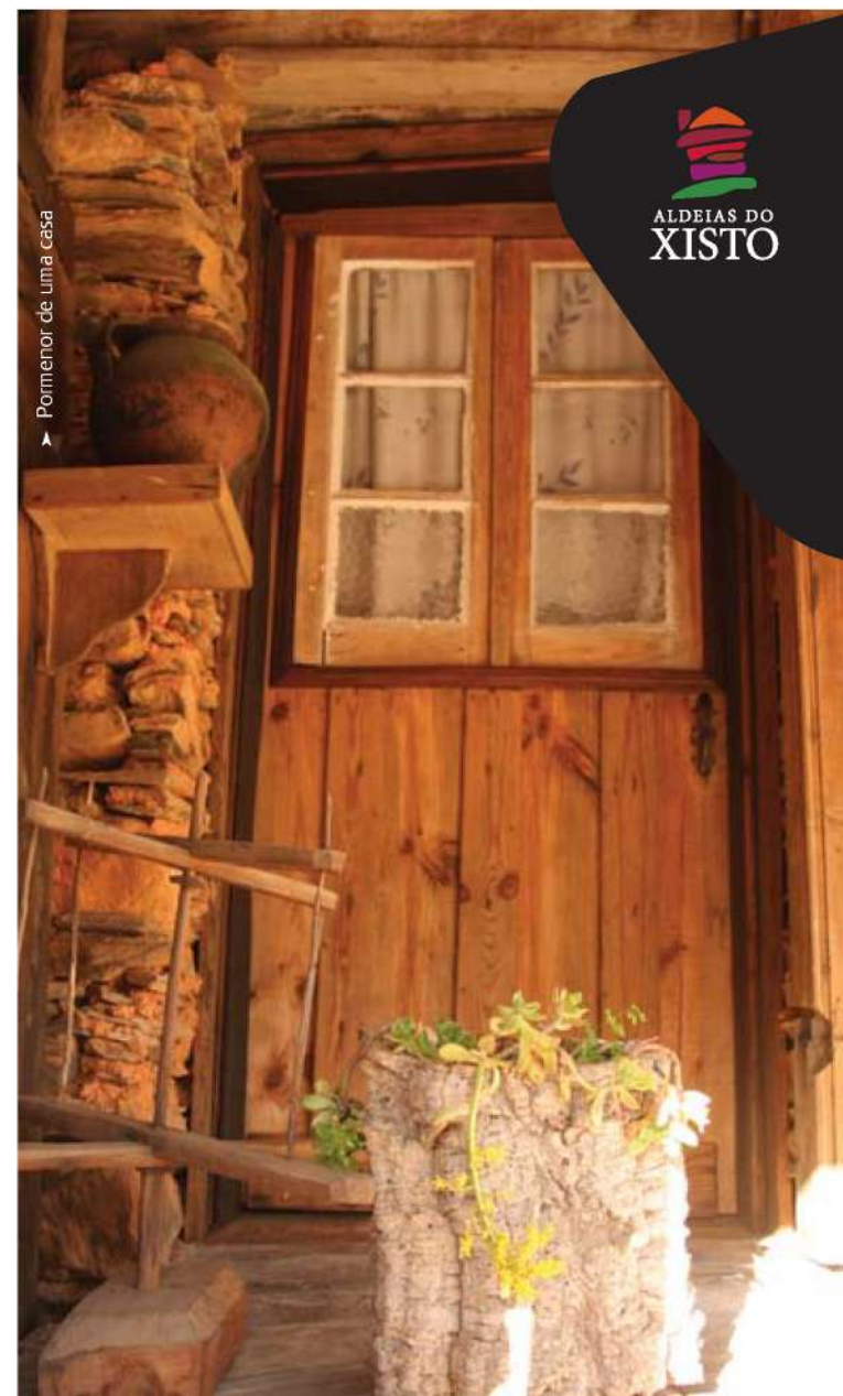
▲ Pormenor de uma casa

Caminho do Xisto de Martim Branco Pela Ribeira de Alameda