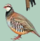
Perdiz (Alectoris rufa)