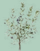
Murta (Myrtus communis)