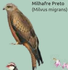
Milhafre Preto (Milvus migrans)