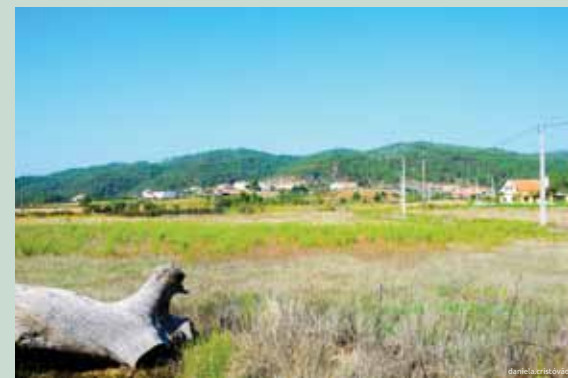
Paisagem da Aldeia da Grade

De St. Ildefonso regressamos à Ribeira que alberga na margem o velho lugar do qual restam apenas as galgas que moíam as azeitonas. Vamos encontrar o Moinho do Pereiro e o Moinho do Casal Novo onde podemos entrar e aprender como era moído o cereal. Estamos agora de volta à Grade e aos seus campos cultivados onde termina este percurso, no mesmo local de onde partimos.