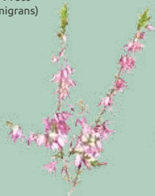
Urze Rosa (Calluna vulgaris)