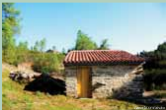
Moinho do Pereiro

A mó de baixo designa-se pouso e tem, tal como a de cima, um buraco circular no centro. O cereal é deitado pelo moleiro na moega, utensílio de capacidade em forma de pirâmide invertida (geralmente de madeira) e vai caindo pela trepidação de uma ou mais ripas de pau, designadas Tramelos que obrigam o grão a sair da Moega pela caleira e entrar nas Goelas da Mó que o vai moer.