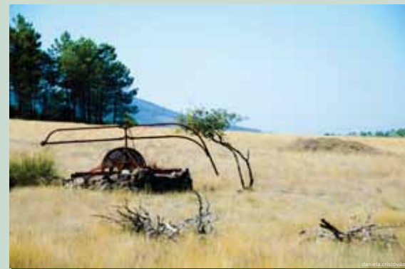
Poço com Nora