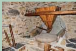
Interior do Moinho

Ao longo de todo o percurso podemos observar variadas espécies de plantas características da flora mediterrânica, entre as quais sobreiros, oliveiras, carvalhos, medronheiros, vinhas, urzes, rosmaninho e estevas, assim como pequenas plantas herbáceas que tornam a Primavera muito mais colorida e perfumada.