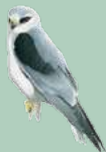
Peneireiro cinzento (Elanus caeruleus)