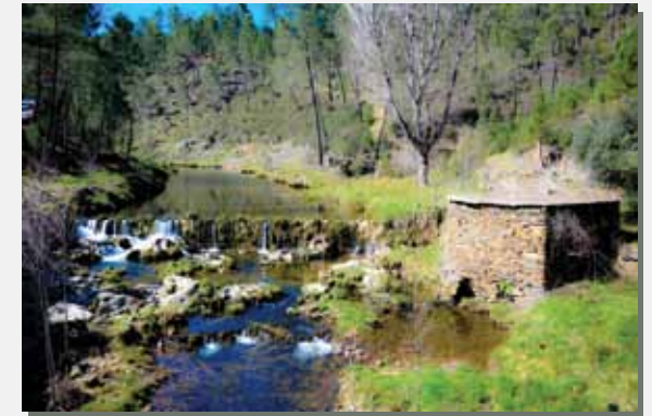
Açude e Moinho na Ribeira da Magueija