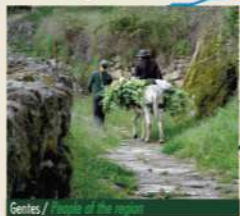
Gentes / People at the rocks

A partir da Rua da Sarça, experimentam-se territórios selvagens, de intensa interacção com a Natureza. É percorrido um estreito trilho que corta a meia encosta este monte-ilha no sentido do Adegueiro. Vale a pena ir até à Pedra Bolideira e experimentar mexer um bloco com centenas de toneladas equilibrado a 5 m do chão! De regresso, o trilho faz-se agora entre antigas hortas num luxuriante sobreiro secular. São intensos os derradeiros momentos que antecedem a chegada ao recinto da Capela de S. Pedro de Vir-a-Corça. Situada numa clareira defendida por colossais penedias, com perspectivas indescritíveis da vertente da montanha conquistada, esta é mais uma jóia do Românico beirão, povoada de lendas e de tradições seculares. Mas o percurso segue novamente por entre sobreiros e penedias no sentido ascendente. Um sinuoso caminho de romaria passa primeiro num estranho bloco granítico que apresenta uma alteração em polígonos bem definidos. Depois, a subida encrespa-se zigzagueando por entre colossos de granito que ora escondem ora apresentam uma paisagem agreste de cortar a respiração. Daqui se regressa à Rua Marquês da Graciosa, à sombra da célebre Torre de Luciano, também conhecida por "torre do galo" por ser encimada por uma réplica do troféu que granjeou Monsanto com o título de "Aldeia mais Portuguesa". A derradeira direcção é agora a do Posto de Turismo, a final de uma viagem sensorial que aqui teve a sua origem.