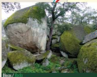
Blocos / Rocks