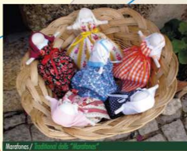
Marionetes / traditional dolls "Marionetes"

where you find the most part of the local commerce. In the Frágua Street, a panel indicates the doctor's Office of Fernando Namora, one of the most important Portuguese novelists ever that worked in Monsanto between 1944 and 1946 and here became in loved by novel writing.