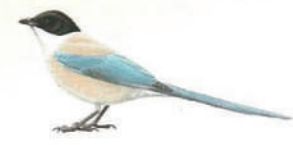
Pega-azul (Cyanopica cyanus)

Junto às linhas de água vêem-se salgueiros, amieiros, choupos e freixos, entre outra vegetação rípícola.