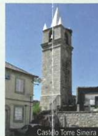
Castelo Torre Sineira

Idanha-a-Nova situa-se num cabeço, aos pés do qual corre o Rio Pônsul. Na vila de Idanha-a-Nova são observáveis as ruínas do castelo, construído em 1187 por D. Gualdim Pais de Maratecos, Mestre da Ordem dos Templários. D. Sancho I eleva a povoação à vila em 1201 e doa-a à Ordem dos Templários. Em 1229 D. Afonso II confirmou-lhe a doação e o foral. Este monarca baptizou a povoação com o topónimo actual, no intuito de a distinguir da velha cidade da Egitânia, a Civitas Igaeditanorum romana, intitulada Eydaia (Idanha) pelos árabes, situada a 18 quilómetros da actual.