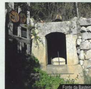
Fonte da Basteira

Situa-se à beira de um velho caminho que, de Idanha, se dirige aos terrenos da campina, descendo a encosta, apenas acessível a pé ou, como outrora, com um burro.