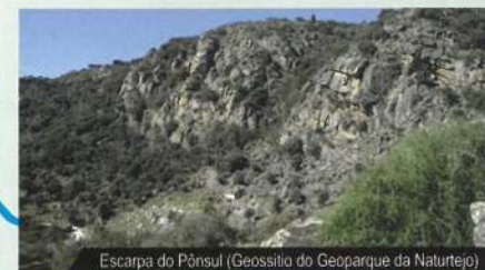
Escarpa do Pônsul (Geossítio do Geoparque da Naturtejo)

As duas regiões, a serra granítica de Idanha-a-Nova e o plano da Várzea, apresentam características geológicas e geomorfológicas completamente distintas, apresentando um contacto brusco. De facto, os trilhos irão levar o visitante para Leste ao longo da escarpa de Falha do Pônsul. A Falha do rio Pônsul é um importante acidente tectónico, que se estende por cerca de 85km em território português, e que se prolonga por Espanha, atingindo um comprimento total de aproximadamente 120km. Tem uma orientação geral ENE-WSW.