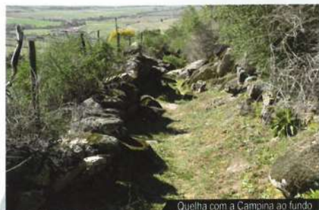
Quelha com a Campina ao fundo

Foi outrora o principal acesso à vila, sobretudo para os que, a pé ou com os seus jumentos, se deslocavam para os trabalhos diários na Senhora da Graça e na Campina de Idanha. Muitos trabalhadores do campo conheciam-na pedra a pedra e os mais idosos ainda hoje recordam os penosos anos em que tiveram de a subir, após um fatigante dia de trabalho. No entanto, a sua referência histórica é uma relíquia que merece ser preservada, assim como as fontes e os chafarizes, que lhes matavam a sede ao longo do caminho.