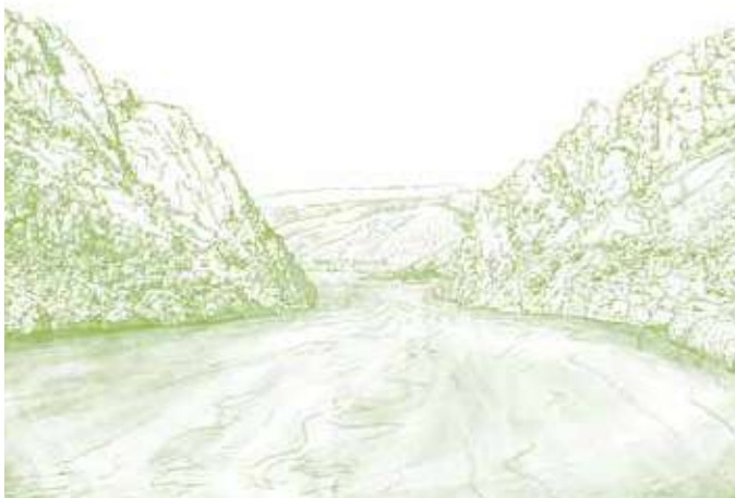
Portas de Ródão. A formação rochosa que já uniu o Alto Alentejo à Beira Baixa.

Este percurso linear representa um troço do Caminho Português Interior de Santiago (Tavira - Nisa - Viseu - Chaves). O troço de Nisa liga o concelho do Crato ao de Vila Velha de Ródão. Atravessa em grande parte um patamar suave, composto por olival tradicional e montado de sobro, onde pastam ovinos e bovinos. Cruza Alpalhão, dando a conhecer o seu património. Ainda antes de Nisa, utiliza um caminho mais antigo em calçada, que acompanha a Ribeira de Figueiró, num troço suave e aprazível. Esta vila impressiona pelo seu património edificado: as antigas portas e os vestígios da sua estrutura fortificada, as igrejas e as ruas estreitas. Continua por mais alguns quilómetros em estrada até à Capela de S. Lourenço, seguindo depois pelos montes até descer para o vale sinuoso da Ribeira de Nisa, que se atravessa numa ponte pedonal. O relevo fica mais irregular e o montado dá lugar a eucaliptos e pinheiros. Atravessa a vertente este da Serra de São Miguel.