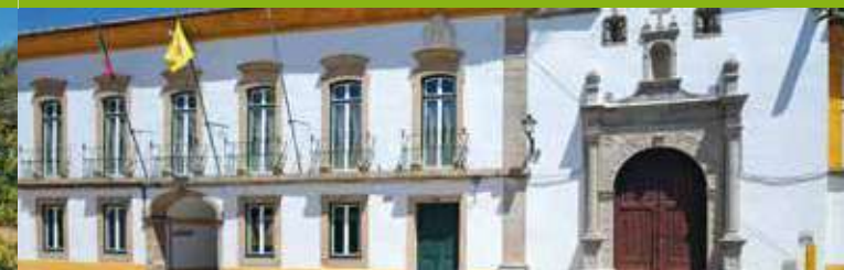
Câmara Municipal de Nisa e Igreja da Misericórdia