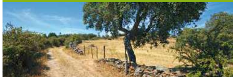
Caminho, junto ao Cruzeiro