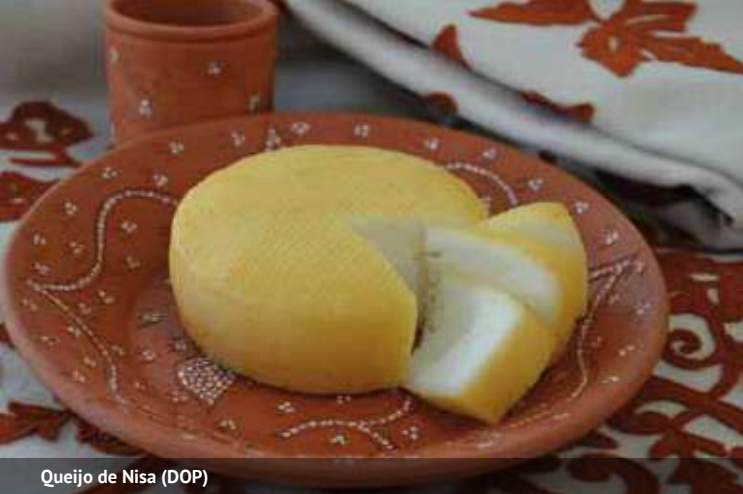
Queijo de Nisa (DOP)