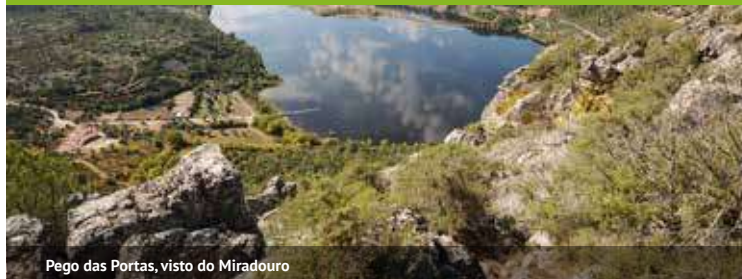
Pego das Portas, visto do Miradouro