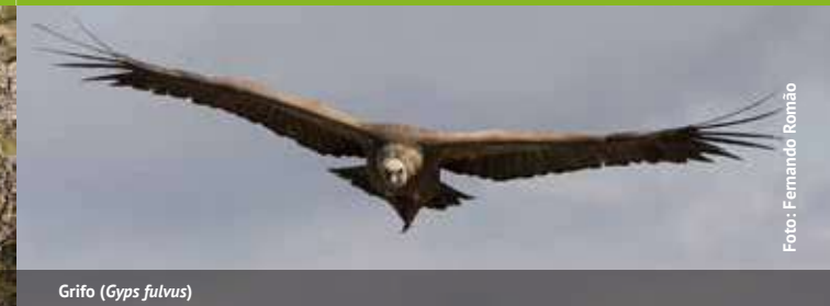
Grifo ( Gyps fulvus )