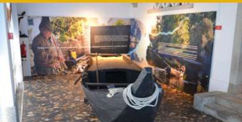
Interior do Centro Interpretativo do Conhal