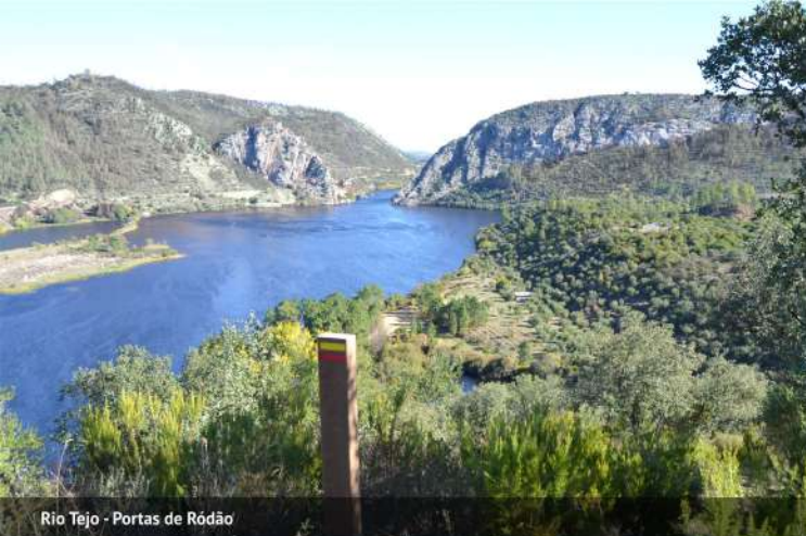
Rio Tejo - Portas de Ródão