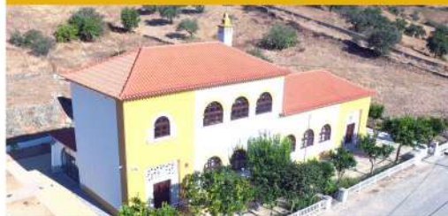
Centro Interpretativo do Conhal