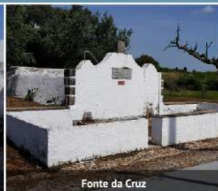
Fonte da Cruz