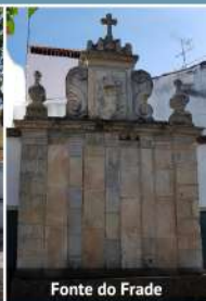
Fonte do Frade