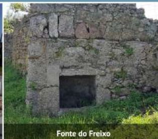
Fonte do Freixo