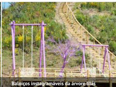
Baloços instagramáveis da árvore lilás