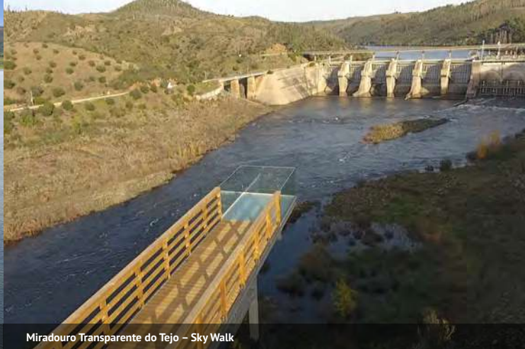
Miradouro Transparente do Tejo - Sky Walk