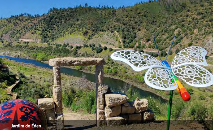
Jardim do Éden