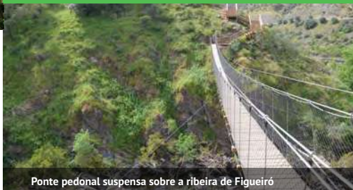
Ponte pedonal suspensa sobre a ribeira de Figueiró