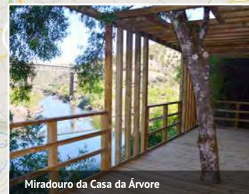
Miradouro da Casa da Árvore