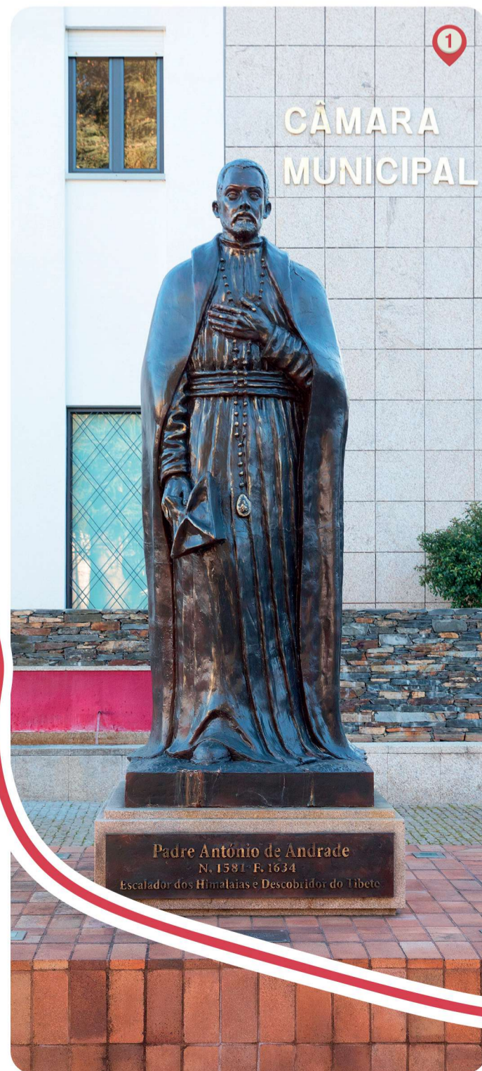
Padre António de Andrade N. 1581. F. 1634 Eskalador dos Himalaias e Descobridor do Tibete

Ao nível arquitetónico e artístico, realçam-se alguns imóveis de Interesse Público (Igreja Matriz e Igreja da Misericórdia) e Valor Concelhio (Capela da Senhora Mãe dos Homens).