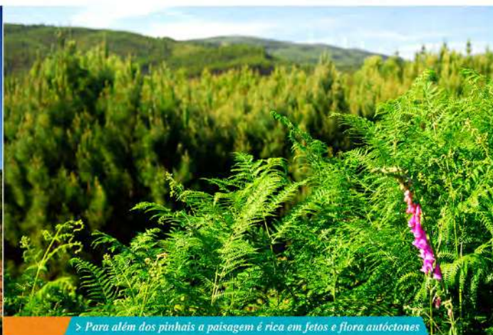
> Para além dos pinhais a paisagem é rica em fetos e flora autóctones