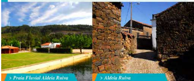
> Praia Fluvial Aldeia Ruiva

Localizado junto às margens da ribeira da Isna, numa zona recatada nas imediações da praia fluvial e envolvido numa agradável vegetação, o Parque de Campismo Rural de Aldeia Ruiva é o local ideal para relaxar. No local pode encontrar sete bungalows para alugar, com cozinha equipada, wc completo com toalhas e roupas de cama, disponíveis durante todo o ano, com lotação até seis pessoas e a preços irresistíveis (época alta de junho e setembro). Um dos bungalows tem rampa de acesso para pessoas com deficiência motora. As reservas devem ser feitas diretamente no formulário do site em www.cm-proencanova.pt , no mínimo com 3 dias de antecedência. Além dos bungalows, pode também reservar espaços no parque de campismo. Mais informações através do Posto de Turismo: 93 96 23 269