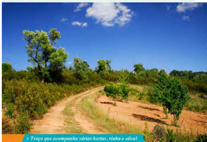
> Troço que acompanha várias hortas, vinha e olival

Os primeiros 300 metros do percurso, inicialmente pela estrada de asfalto, têm uma inclinação ligeira até à pequena povoação de Aldeia Ruiva; o caminho segue neste ponto mais elevado por uma estrada de terra batida rodeada por pequenos olivais e hortas e onde poderá observar os primeiros exemplares da avifauna autóctone, como milhafres, águias e cegonhas pretas. Mais à frente, no primeiro cruzamento do caminho, o percurso muda e a partir daqui, os restantes 1,7Km são percorridos em forma circular.