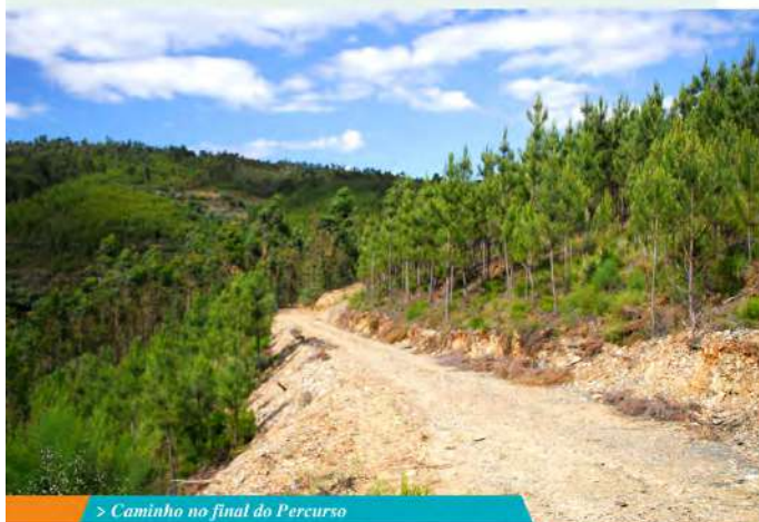
> Caminho no final do Percurso

Deixamos a Pedreira entregue à sua quietude e continuamos o trilho subindo a encosta ladeados pelos pinhais que parecem curvar-se à nossa passagem. Respirar o ar puro, beber a luz do lugar e absorver a paisagem que nos envolve é quanto basta para recuperar de uma semana de trabalho, do rebuliço das cidades ou dos momentos menos bons da vida. Num dia favorável, poderá ver o céu recortado com o voo majestoso das aves de rapina tornando ainda mais fantástica a sua caminhada. Damos conta que o caminho se aproxima do fim quando voltamos a ouvir o canto da água correndo entre as pedras, ou, se for verão, o riso efusivo das crianças a brincar no parque ou dos vibrantes mergulhos no plano de água, onde os veraneantes aproveitam para usufruir do espaço na sua plenitude. Se o tempo estiver de feição, aproveite para reforçar esta energia positiva com um refrescante banho na praia fluvial.