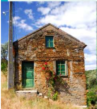
> Casa de Xisto (Pedreiras)

A aldeia de Pedreira é um daqueles lugares mágicos, gratiosos, cheios de histórias para contar. Embora atualmente sem residentes fixos, o aglomerado de casas de xisto foi em tempos um dos principais centros de moagem de farinha para as gentes de Sobreira Formosa, que percorriam o caminho pelo seu pé, vezes sem conta, carregados com pesadas sacas de farinha até à vila. Ao entrar na aldeia, pelo caminho de terra batida, não é difícil imaginar os sons de outrora, das mós que trabalhavam noite e dia nas inúmeras azenhas junto à ribeira, da azáfama do lagar, ou da água que ainda hoje cai sob a bela e antiga ponte de xisto. Nas imediações da aldeia e junto ao percurso, na margem direita da ribeira da Fróia, fica um grande e belíssimo complexo de tulhas, que povoam a encosta até às margens. Em outros tempos, este grande aglomerado de mais de vinte construções de xisto serviu para guardar a azeitona enquanto "esperava" para "entrar" no lagar e transformar-se em verdadeiro ouro líquido.