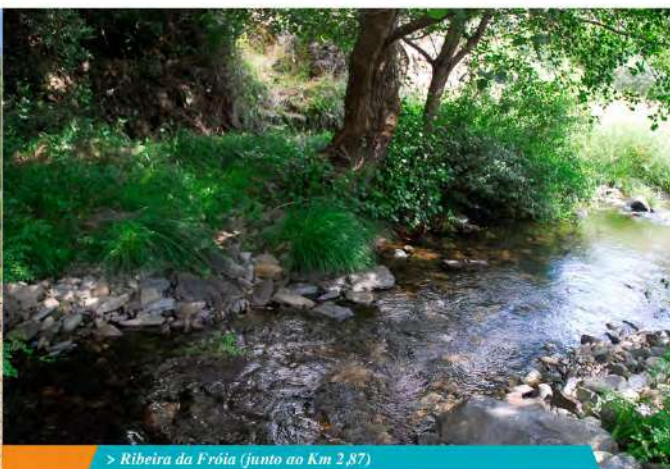
> Ribeira da Fróia (junto ao Km 2,87)