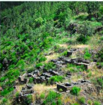
> Tulhas na encosta junto à aldeia de Pedreira