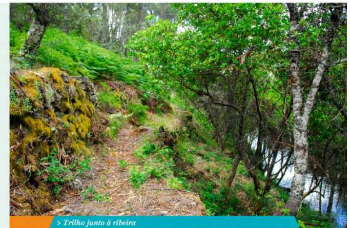
> Trilho junto à ribeira

Seguindo o sentido do parque de merendas Infilita para a 'levada' que ladeia a ribeira da Isna. Esta ribeira nasce na Serra do Cabeço Rainha (Serra de Alvêolos) percorre 45,5 km até desaguar no Zêzere na barragem de Castelo de Bode, na Aldeia de Fernandaires (Vila de Rei) e faz fronteira entre o concelho de Proença-a-Nova (margem esquerda) e o da Sertã (margem direita). E sem margem para enganar seguimos então pela 'levada' adiante até à pequena aldeia de Cabrieira onde poderá ser surpreendido pela simpatia dos seus moradores. O trilho avança mais um pouco até um ligeiro açude a montante, retomando o caminho até à Cabrieira e daqui até à praia pelo mesmo percurso, se bem que com uma perspetiva diferente sobre o mesmo.