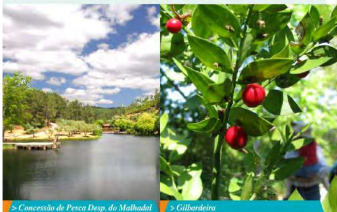
> Concessão de Pesca Desp. do Malhadal

Com uma extensão de 2,9 quilómetros e uma área aproximada de 3,7 hectares, a concessão de pesca desportiva do Malhadal acompanha grande parte do percurso junto à ribeira da Isna. Os interessados em solicitar uma licença diária devem dirigir-se ao Balcão Único do Município de Proença-a-Nova ou, no fim de semana, ao posto de turismo. O regulamento da concessão fixa as oito espécies a pescar, os períodos de pesca e o número de capturas permitido diariamente a cada pescador. Boga, carpa, barbo e achigã são as principais espécies existentes e estão associadas a alguns pratos típicos do concelho – é o caso da salada de almeirão com achigã frito ou das sopas de peixe. O período de pesca desportiva decorre entre 16 de maio e 15 de março, mas há peixes para os quais não está estipulado período de defeso. É o caso da perca-sol, pimpão, alburno, ablete e escalo (chamado bordalo). Algumas associações locais promovem encontros regulares de pesca recreativa. Para mais informações contacte o posto de turismo (939 623 269).