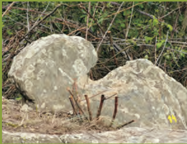
Cabeço de amarração

paredes de xisto e pequenas hortas, encontram-se devidamente assinalados um pequeno túmulo e um lagar, ambos escavados no xisto. A cerca de 200 metros deste local inicia-se o caminho secular da Barreira da