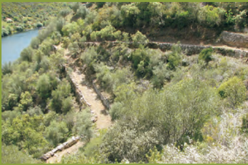
Barreira da Barca

O PR 5 “Caminho da Telhada” é um percurso circular, com cerca de 6 Km, situado na localidade de Perais, freguesia do concelho de Vila Velha de Ródão, assente numa plataforma plana, que corresponde ao terraço fluvial mais antigo do rio Tejo, formado há cerca de 1 milhão de anos.