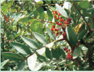
Aroeira ( Pistacia lentiscus )

Neste contexto natural vivem diferentes espécies animais como o javali ( Sus scrofa ), a geneta ( Genetta genetta ), o britango ( Neophron percnopterus ), a cegonha-preta ( Ciconia