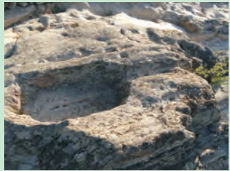
Lagar da Telhada

energias e tire partido da paisagem. Siga as orientações da sinalética e vire à esquerda subindo pelo caminho assinalado, em direcção ao Ribeiro das Ferraduras, assim conhecido pela existência de gravuras insculpidas na rocha em forma de ferradura. Este caminho, fácil de percorrer, e com