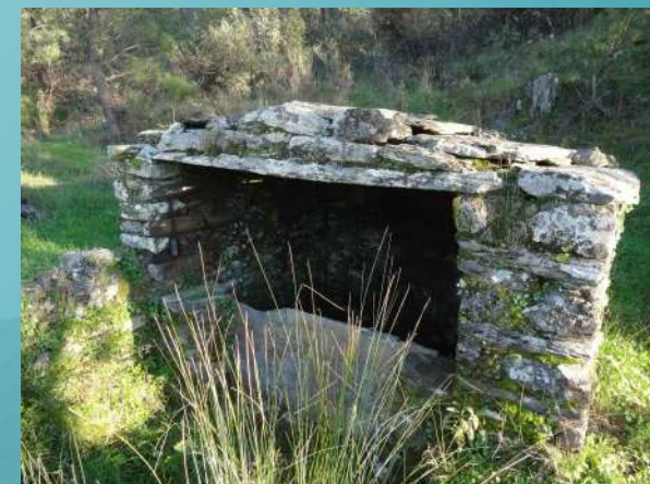
Fonte de Pato