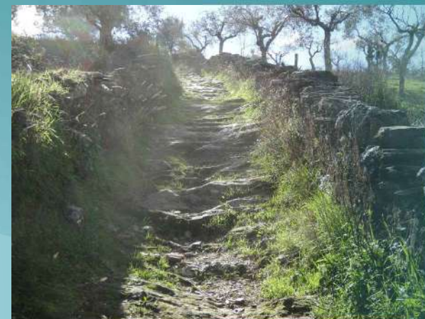
Quelha da Fonte Nova

O acesso à Fonte Nova era efetuado através da Quelha da Fonte Nova, caminho estreito escavado no afloramento de xisto e murado. À medida que o piso se ia desgastando com o uso e tornando mais escorregadio, as populações iam escavando pequenos degraus para facilitar a circulação pedonal. Esta fonte devido à sua utilização frequente foi, mais