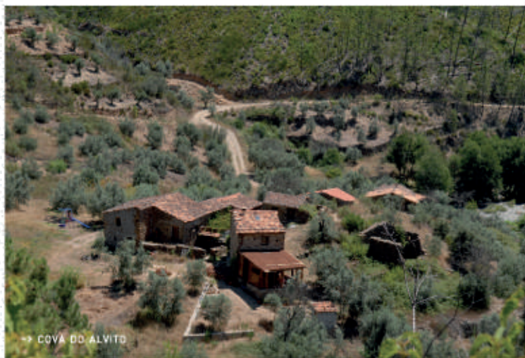
→ COVÃ DO ALVITO