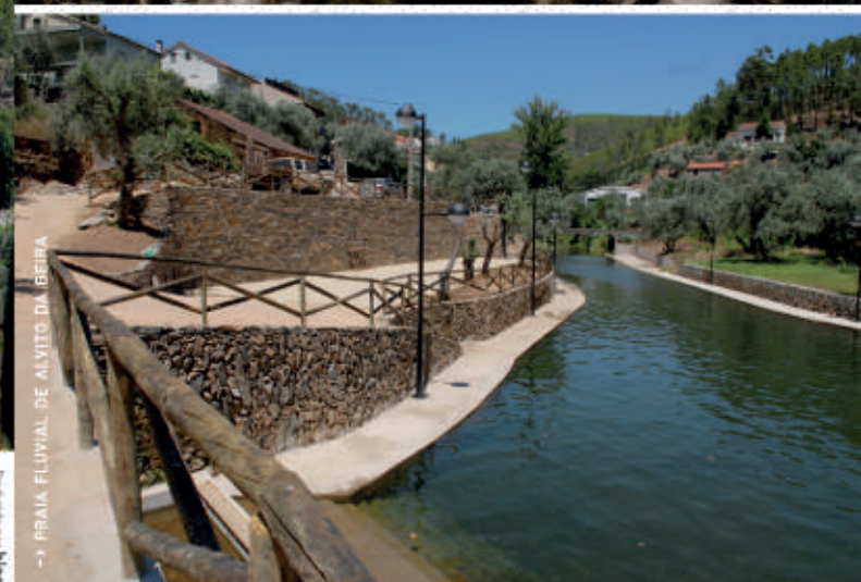
→ PRAIA FLUVIAL DE ALVITO DA BEIRA