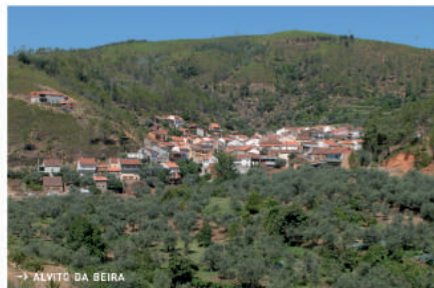
→ ALVITO DA BEIRA

A aldeia que dá o nome à Ribeira do Alvito também baptizará um dos mais importantes projectos públicos do distrito de Castelo Branco: a barragem do Alvito. Há mais de 50 anos que existem estudos sobre o aproveitamento hidroeléctrico do Alvito, no Rio Ocreza, mas só agora com o anúncio da sua construção (Outubro de 2011) se prevê o aproveitamento destes cursos de água, totalmente nacionais, para a produção de energia eléctrica mas também para a criação de uma albufeira que servirá como reserva estratégica para toda a região e um catalisador turístico muito importante.